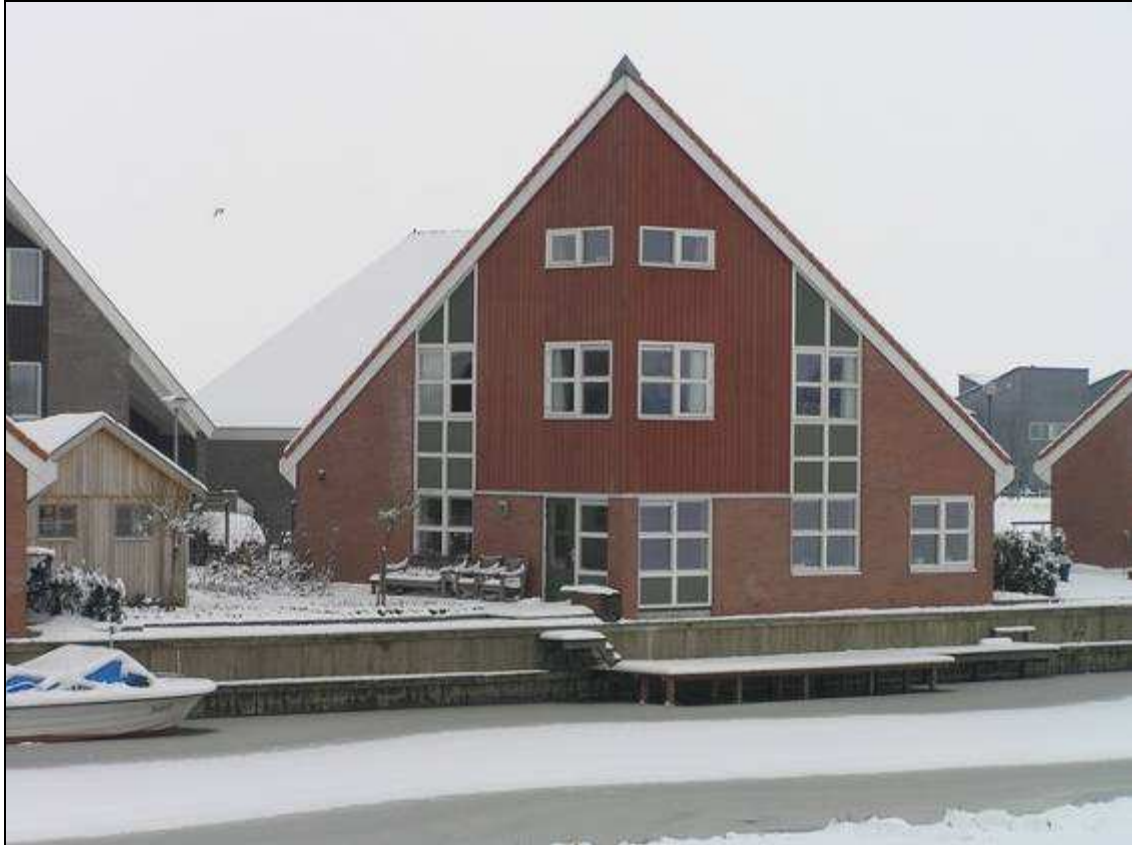
La casa di Pieter Bleeker dove avverrà l'incontro italo-olandese.